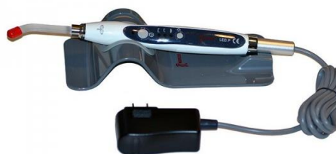
LED-P s adaptérom