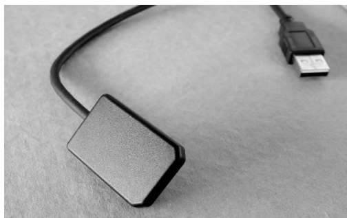
RVG SYSTEM 1. veľkosť