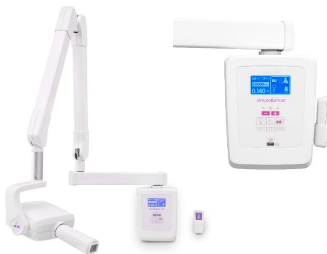
Röntgen RX70 DC