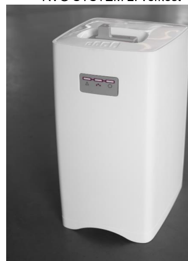
Phosphor plate scanner