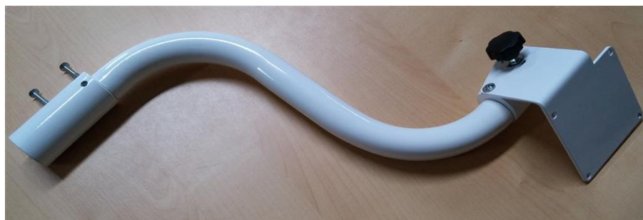
Univerzálne rameno monitora - montáž na stĺp svietidla