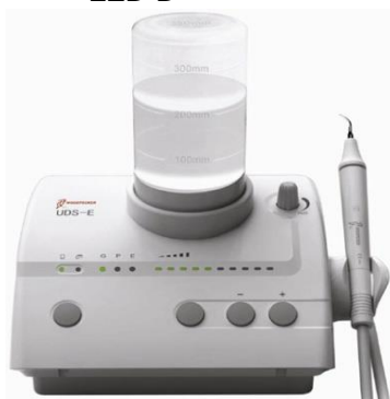
UDS-E stolný UOZK