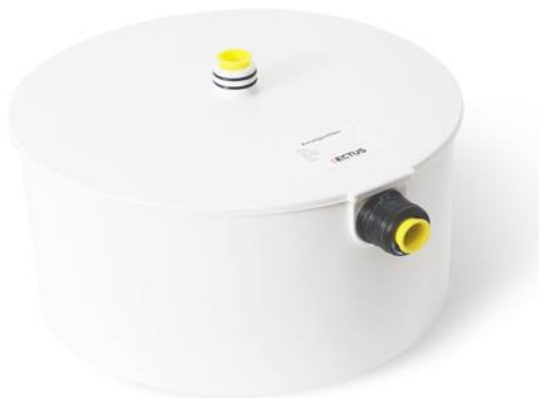
Rectus amalgám filter