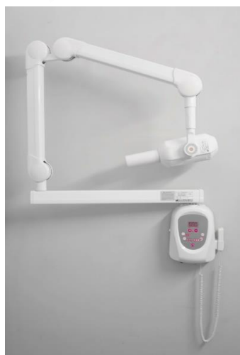
Röntgen RX70 AC