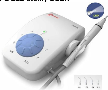
UDS-K LED stolný UOZK