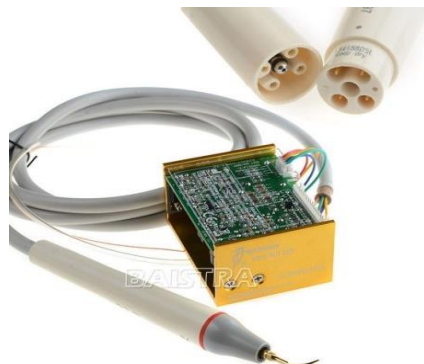
UDS-N3 LED zabudovateľná sada UOZK