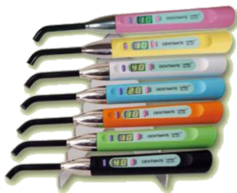
LEDEX - WL-070