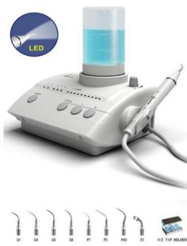
UDS-E LED stolný UOZK