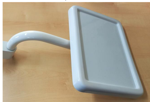
Univerzálna kovová tácka - montáž na stĺp