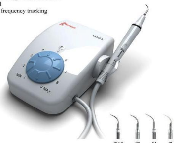
UDS-K stolný UOZK

detachable handpiece autoclavable PC control automatic frequency tracking