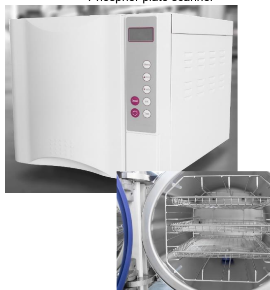
Autokláv Class B 18L / 23L