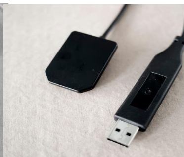
RVG SYSTEM 2. veľkosť