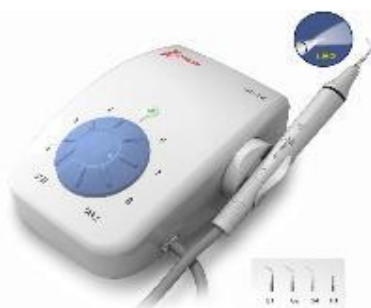
UDS-K LED asztali depurátor