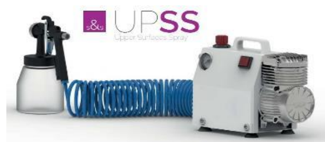
UPSS - kompresszoros felület fertőtlenítő porlasztó