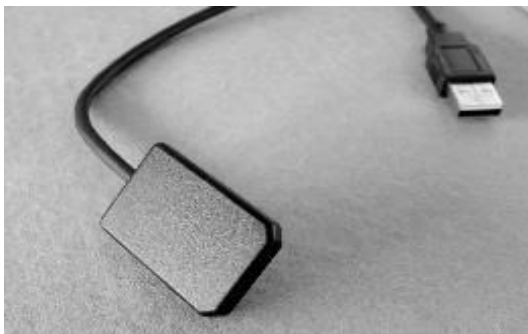
RVG SYSTEM 1. méret