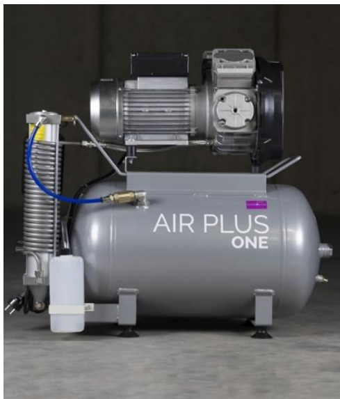
AIR PLUS ONE + D (szárítós)