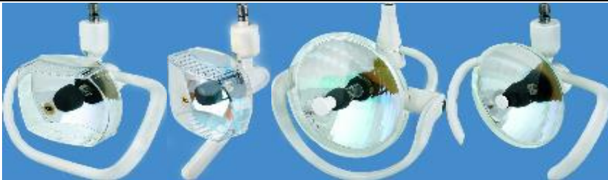
CLT 01 / LED