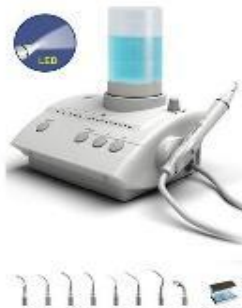
UDS-E LED asztali depurátor