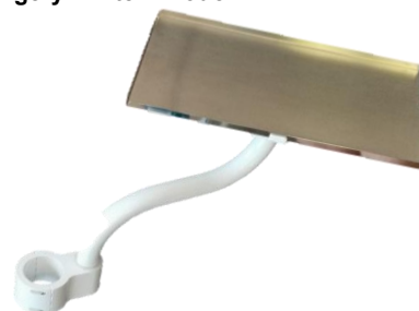
Univerzális műszer tálca (fém) - lámpa oszlopra szer.