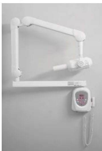
Röntgen RX70 AC