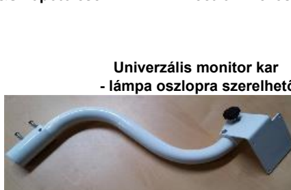
Univerzális monitor kar - lámpa oszlopra szerelhető