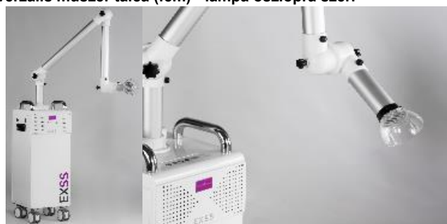
Simple&Smart EXSS - extraorális elszívó berendezés