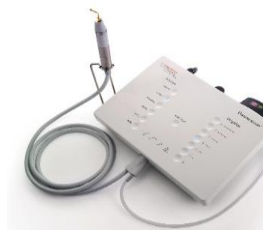
Mectron Piezosurgery White / Touch