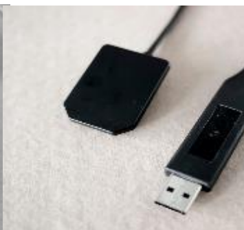
RVG SYSTEM 2. méret