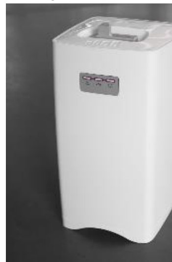
Phosphor plate scanner