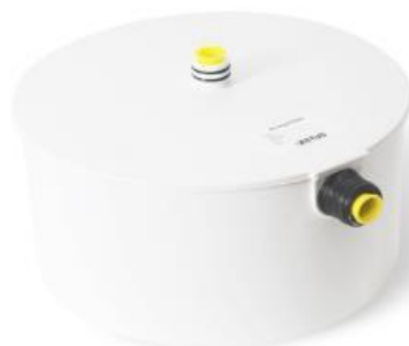
RECTUS amalgám filter