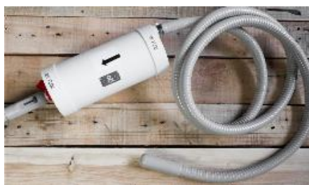
S&S Easy connect (csatlakozás)