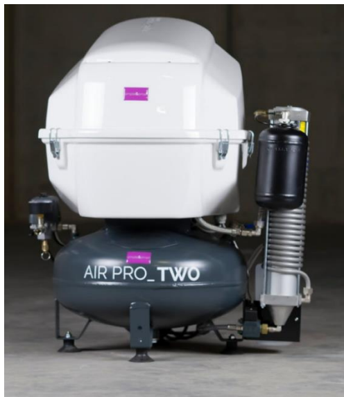
AIR PRO TWO + D + S (szárítós, hangszigetelt)