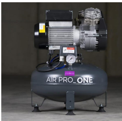
AIR PRO ONE

* Nagyobb levegő teljesítmények és tartályok megrendelésre (kérjen árajánlatot)