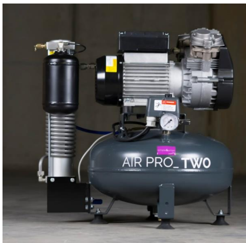
AIR PRO TWO + D (szárítós)